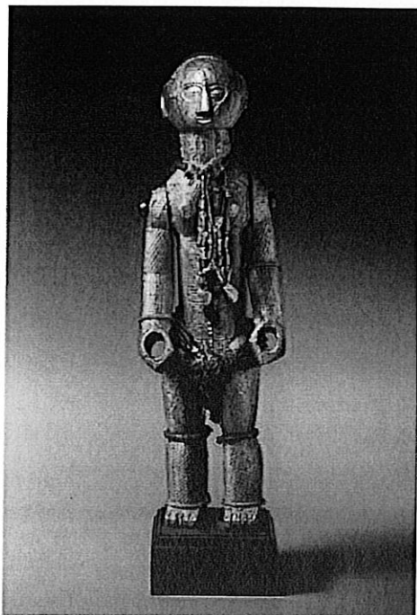
Statue Akyé, Côte d'Ivoire, bois, or, perles, fibres et autres matériaux, h. 44 cm.

Vendue 624 800 euros. Binoche & Giquello, le 19 mai.