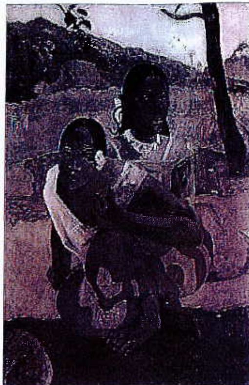
Nafea faa ipoipo (1892) Paul Gauguin

Du côté des salles de ventes, l'obligation de transparence s'incarne dans la formule pass, aux États-Unis, pour un lot non vendu et adjudgé, en France, pour un lot vendu, rien pour un invendu. Certains suggèrent même d'instaurer une loi obligeant à dévoiler systématiquement la provenance des objets. Mais diverses techniques faussent totalement les enchères : la fausse facture, mais aussi la fausse enchère consistant à confier un objet à une tierce personne à qui l'on souhaite donner une certaine somme, sous couvert des enchères, pour qu'il bénéficie du fruit de la vente, où la maison de ventes joue le rôle de passeur à son insu. Au delà de la spéculation, le simulacre psychologique et spéculatif peut prendre des airs de toute bonne foi en salle des ventes : une personne peut acheter plusieurs œuvres, en proposer une et faire monter artificiellement les enchères, quitte à la racheter elle-même, pour ensuite découpler la cote et les futurs résultats des autres œuvres. Les deux géants Christie's et Sotheby's affirment leur implication dans la traque des malversations et fraudes en tout genre, mais dans ce contexte de concurrence bicéphale, chaque client compte.